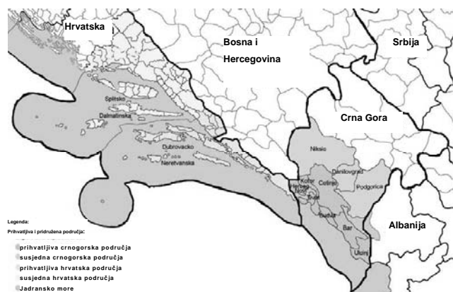
Map 1: Eligible and adjacent area in Croatia and Montenegro